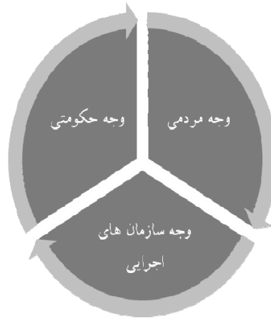
نمودار شماره ۱-۲: وجوه حکومت محلی